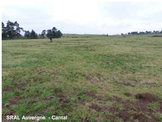
SRAL Auvergne - Cantal

Le Vernet Sainte Marguerite : Campagnols terrestres: Présence notée sur une partie de la commune (Mareuge, Saignes). Taupes: Présence moyenne à forte selon les zones.