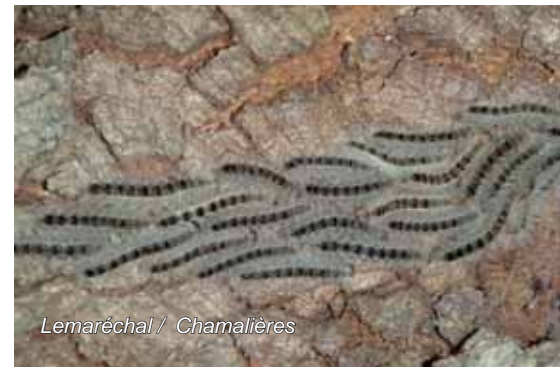
Lemaréchal / Chamalières