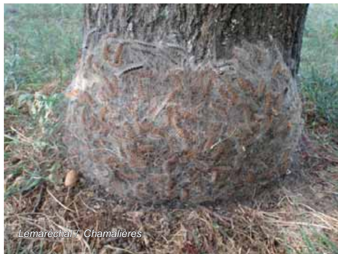
Lemaréchal / Chamalières

Dans les secteurs pollués par ces poils les risques d'urtications peuvent se prolonger pendant plus d'un an en particulier si les poils sont conservés dans un environnement sec.