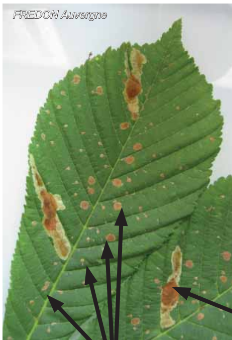
Galerie de chenille ayant donné un papillon du deuxième vol