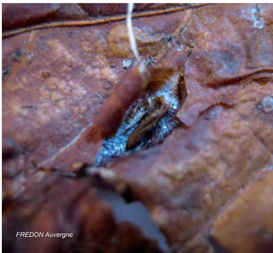
Nymphe de mineuse du marronnier dans l'épaisseur d'une feuille morte de marronnier

Ces nymphes se trouvant sur les feuilles mortes tombées au sol, le ramassage complet des feuilles et leur destruction est une mesure préventive limitant les populations d'adultes le printemps suivant.