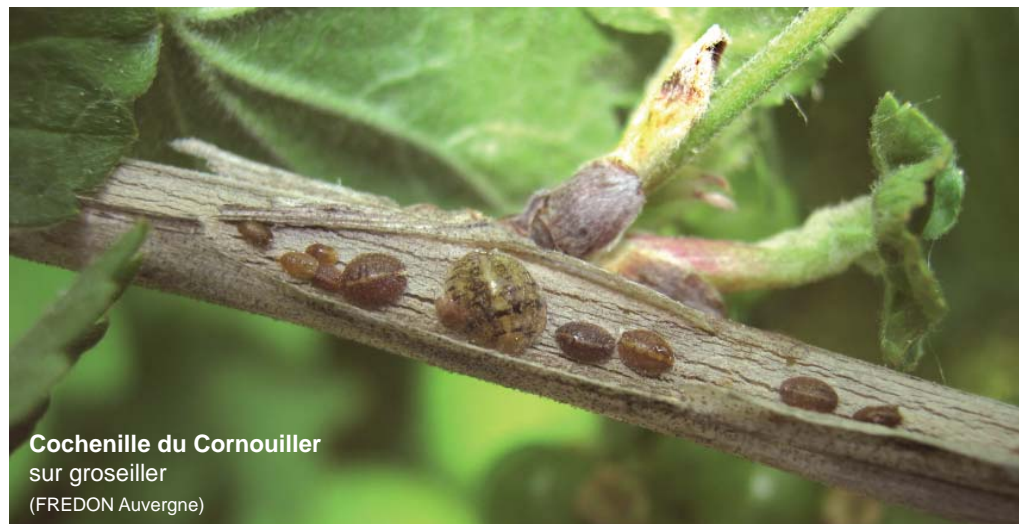
Cochenille du Cornouiller sur groseille

Ce phénomène physiologique s'explique par les conditions climatiques défavorables à la nouaison (temps froid et humide, vent fort).