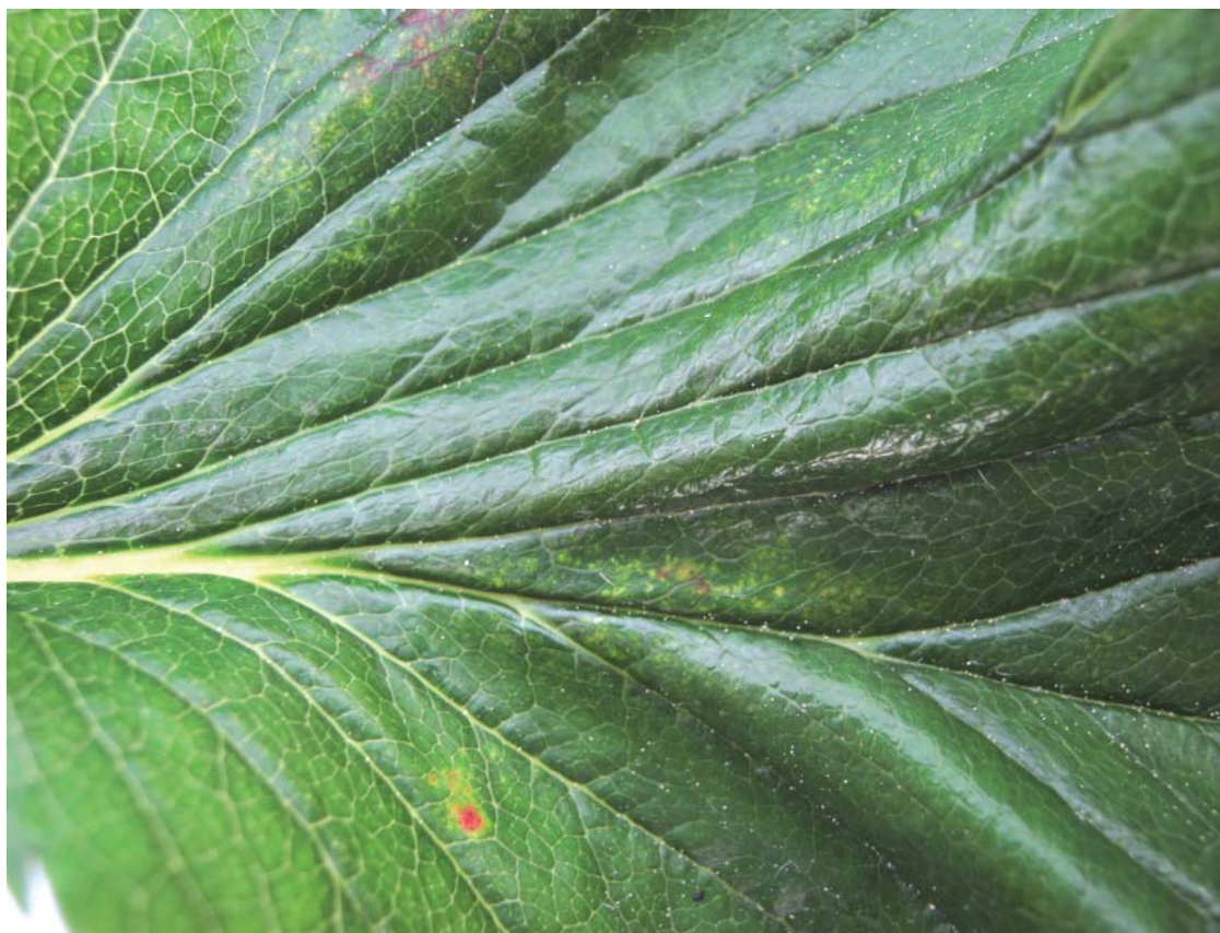
Acariens tétranyques : Dégâts sur feuille

Enfin, peu d'acariens prédateurs sont présents donc il faudra surveiller attentivement les parcelles dans les prochains jours.