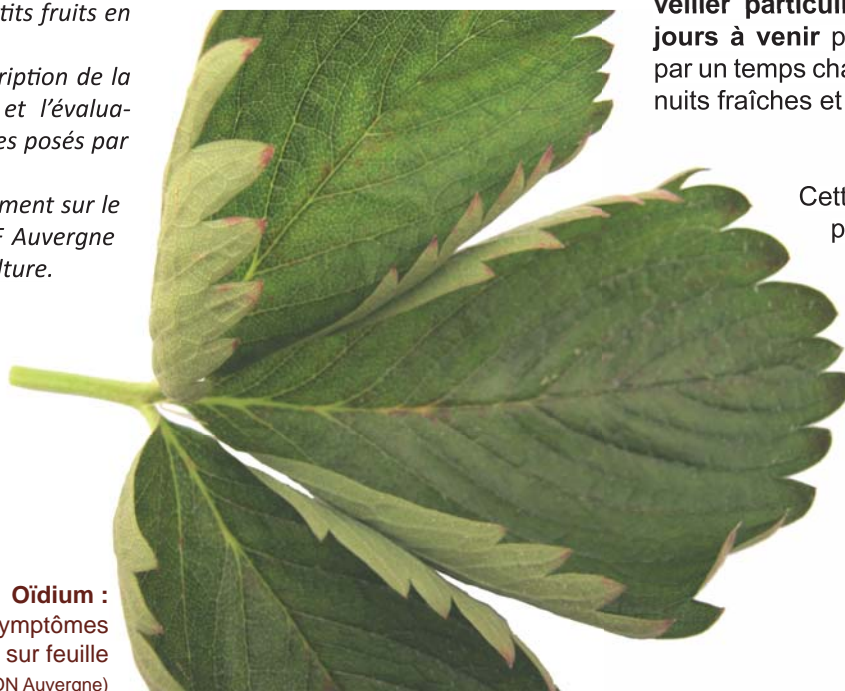
Oïdium : Symptômes sur feuille

Cette remarque s'applique d'autant plus à la variété Cléry qui est une variété nouvellement plantée sur le secteur et semble être a priori la plus sensible à l'oïdium.