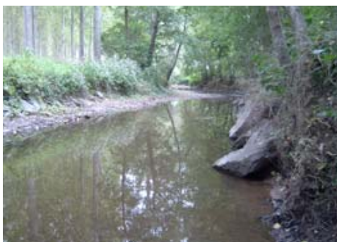
Suivi de cours d'eau avec relevé d'indices de présence

Gestion des déclarations de dégâts de ragondins et rats musqués