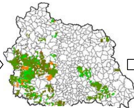
Réalisation de cartographies d'évolution des nuisibles