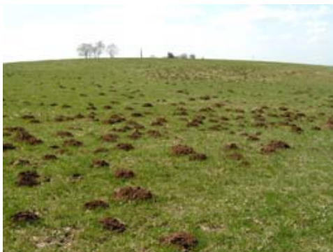
Suivi des prairies et notations d'indices de présence